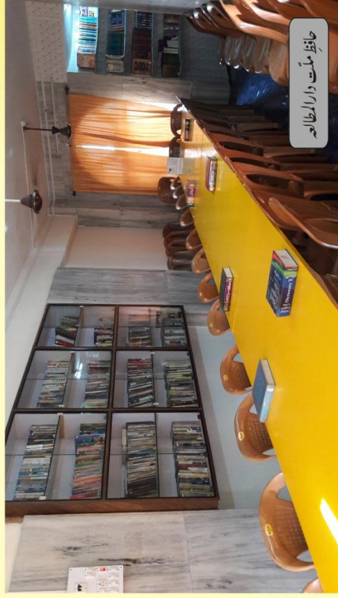
حافظ مکتب دارالمطالعہ