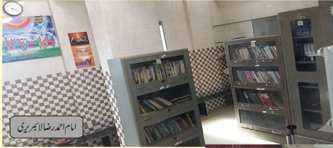
امام احمد رضا لاہوری