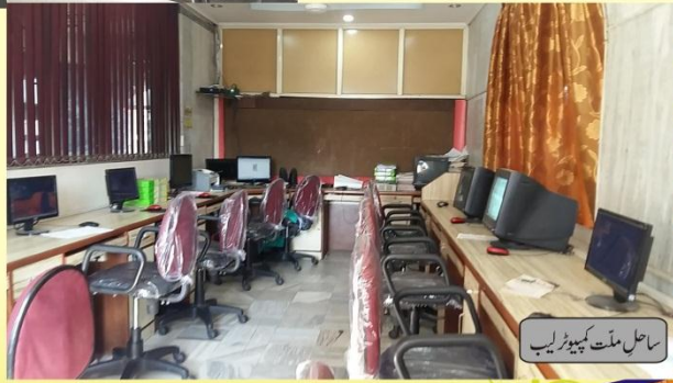
ساحل مکتب کمپیوٹر لیب