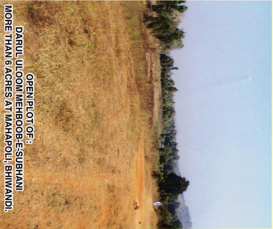
OPEN PLOT OF : DARUL ULOOM MEHBOOB-E-SUBHANI MORE THAN 6 ACRES AT MAHAPOOLI, BHIWANDI.